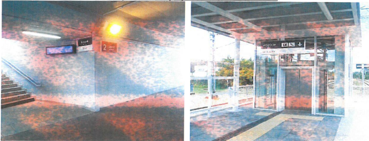
Schody na drugi peron oraz winda na drugi peron