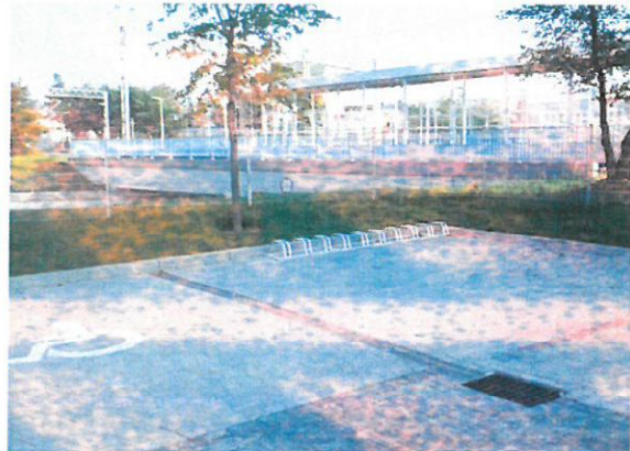
Przestawiony stojak w miejsce bez miejsca postojowego

Dokumentacja w powyższym zakresie stanowi załącznik nr 3 do akt kontroli.