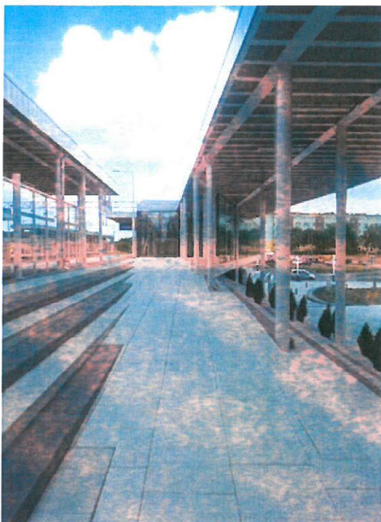
Pochylnia z dojściem do POP i peronu