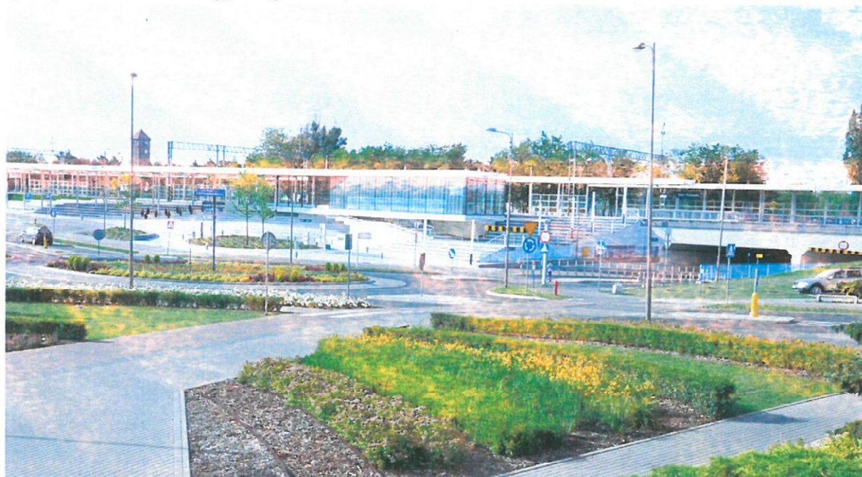
Zdjęcie udostępnione przez Beneficjenta przedstawiające POP i wiadukt.

W dniu 28.06.2016 r. ZK przeprowadził oględziny miejsca realizacji Projektu podczas których sporządzono dokumentację fotograficzną.