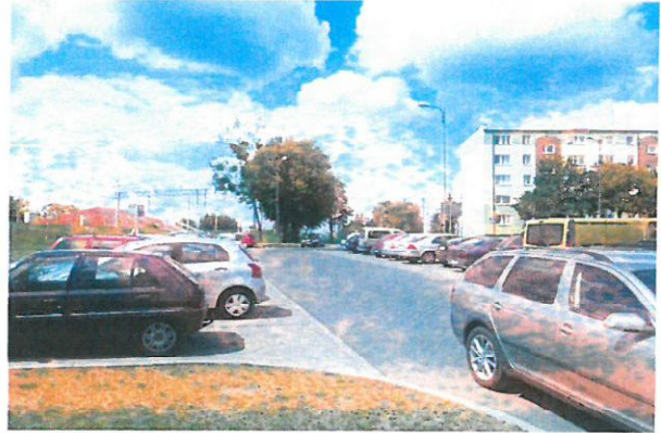
Dwa parkingi „park&ride”