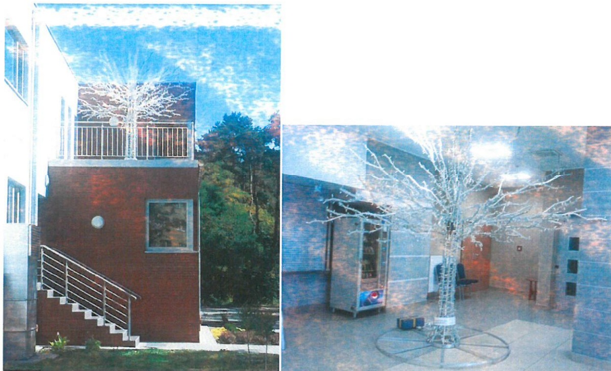
Zdjęcia zmontowanych drzewek przekazane przez kontrolowanego (w tymczasowej lokalizacji)