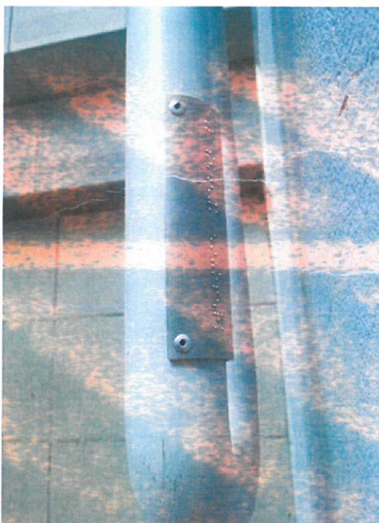
Oznakowanie dla niewidomych