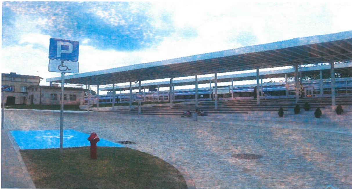
Zatoka autobusowa, miejsce parkingowe dla osób niepełnosprawnych

Podczas prowadzonych oględzin miejsca realizacji Projektu ZK stwierdził, że na jednym z miejsc postojowych parkingu „park&ride” został ustawiony stojak rowerowy. ZK zalecił aby przedmiotowy stojak przestawić w inne miejsce, które nie będzie skutkowało zmniejszeniem zakładanej liczby miejsc postojowych. W celu wykonania zalecenia zobowiązał Beneficjenta do przekazania dokumentacji fotograficznej po przeniesieniu stojaka.