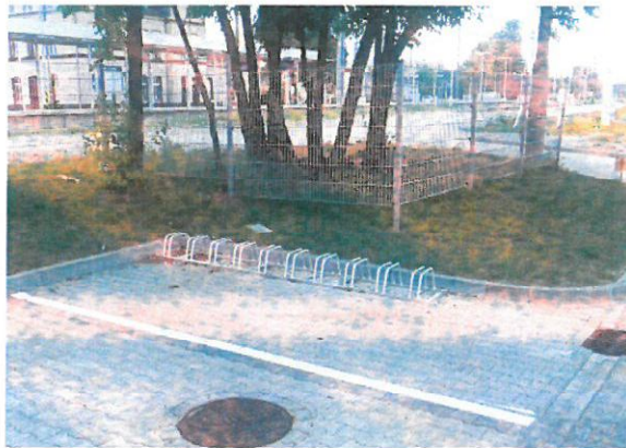
Stojak na miejscu postojowym