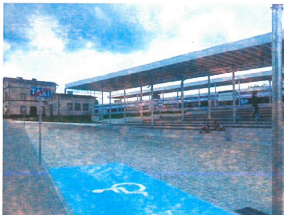
Miejsca parkingowe dla osób niepełnosprawnych