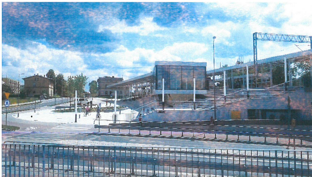
Zdjęcie POP od strony wjazdu do tunelu pod wiaduktem kolejowym.