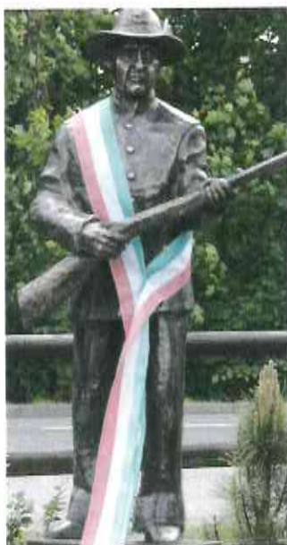
Fotografia nr 7.- Pomnik Strzelca Kurkowego

W Bibliotece Publicznej w maju 2018 r. uroczystie otworzyli salonik Ireny Santor, w którym wyeksponowane zostały pamiątki zbierane przez wybitną piosenkarkę - Honorowego Obywatela Solca Kujawskiego. Kameralny salonik wraz z eksponatami z życia piosenkarki, stanowi element promujący miasto oraz dodatkową atrakcję dla przybyłych turystów oraz mieszkańców.