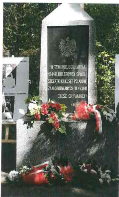
Fotografia nr 4. – Pomnik w Otorowie (stan po remoncie)

odrestaurowania pomnika wystąpiła Druga Sołecka Gromada Zuchowa CHOJRAKI, która w ramach programu CZUWAMY ! PAMIĘTAMY ! organizowanego przez Fundację „ORLEN – DAR SERCA”, wystąpiła o środki finansowe przeznaczone na prace renowacyjne pomnika. Powyższa inicjatywa została zrealizowana przy wsparciu finansowym ze strony gminy (kwotą 900,00 zł), sołeckiej firmy „GRANIT” oraz Nadleśnictwa Solec Kujawski. Podczas uroczystości związanych z odsłonięciem pomnika, wyeksponowane zostały tablice przedstawiające historię miejsca kaźni Polaków oraz poprzednie formy jego upamiętnienia.