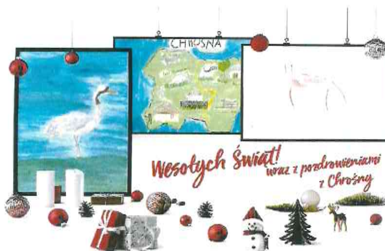
Fotografia nr 13.- Kartki świąteczne promujące wieś Chrośna

W grudniu 2019 r. podczas dwudniowych warsztatów diagnostyczno – rozwojowych, których głównym celem było przygotowanie diagnozy społeczno – ekonomicznej gminy, zebrane zostały informacje mające kluczowy wpływ na rozwój gminy oraz identyfikację działań rozwojowych. Powyższe informacje przygotowane przez samorządowców, przedstawicieli soleckich instytucji, organizacji i przedsiębiorców zostały wykorzystane przez do opracowania strategii rozwoju gminy, która obok gminnego programu opieki nad zabytkami oraz gminnego programu rewitalizacji stanowić będzie program wspierający działania soleckiego samorządu.