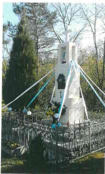
Fotografia nr 3. – Kapliczka w Przyłubiu (stan po remoncie)

W maju 2019 r. przeprowadzone zostały prace związane z odnowieniem kapliczki w Przyłubiu, ujętej w Wojewódzkiej Ewidencji Zabytków oraz w Gminnej Ewidencji Zabytków Gminy Solec Kujawski. Prace na kwotę 6 765,00 zł wykonała firma „GRANIT” z Solca Kujawskiego.