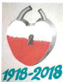
Fotografia nr 6.- plakat promujący 100 rocznicę odzyskania niepodległości przez Polskę

Parlamentu Europejskiego. W ramach powyższej inicjatywy został on również fundatorem nagrody głównej dla laureata konkursu.