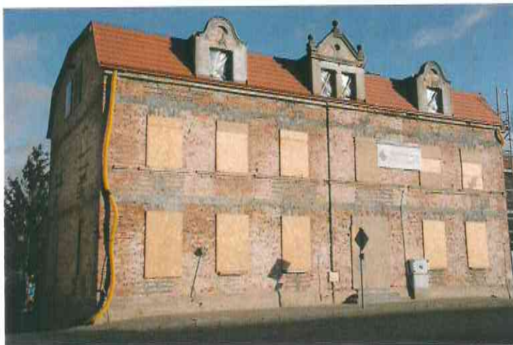
Fotografia nr 2. – Plac Jana Pawła II 4 (inwestycja w trakcie realizacji)

wydanie stosownej opinii w tej sprawie zwrócono się do Wojewódzkiego Konserwatora Zabytków w Toruniu oraz do Instytutu Pamięci Narodowej – Oddział w Gdańsku. Powyższa inicjatywa uzyskała pozytywną opinię konserwatora zabytków oraz wyrazy uznania ze strony Instytutu Pamięci Narodowej . Kompleksowe prace związane z odnowieniem reprezentacyjnej przestrzeni miasta, rozpoczną się w 2020 r.