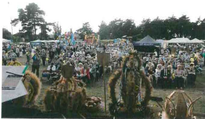
Fotografia nr 10. – Dożynki gminne oraz Dożynki Powiatowe

8 września 2018 r. na terenie Solca Kujawskiego, odbyły się Dożynki Powiatowe oraz Dożynki Gminne. Po zakończonej mszy świętej, na boisku treningowym Ośrodka Sportu i Rekreacji, odprawiony został ceremoniał dożynkowy. Po zakończonym ceremoniale, przeprowadzone zostały konkursy: na „Najładniejszy wieniec dożynkowy”, „Najładniejsza kompozycja dożynkowa”, „Najładniejsze stoisko promocyjne”. W wieczornym programie artystycznym zaprezentowały się zespoły: Patrycja Siwak – Runo „Gipsy Stars”, Goosebumps. Dodatkową atrakcją organizowanej imprezy, były liczne stoiska promocyjne, atrakcje dla dzieci, poczęstunek od firmy „Drobex” oraz od Kół Gospodyń Wiejskich z terenu Gminy Solec Kujawski.