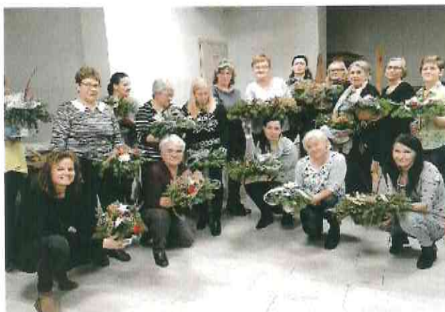
Fotografia nr 12 – warsztaty rękodzielnicze w świetlicy wiejskiej

W grudniu 2019 r. w świetlicy wiejskiej, przeprowadzone zostały warsztaty rękodzielnicze skierowane do rolników oraz członkiń Kół Gospodyń Wiejskich z terenu gminy, podczas których uczestniczki poznały obyczaje i tradycje bożonarodzeniowe, ponadto w ramach zajęć wykonały kompozycje i stroiki świąteczne. W sołectwie Chrośna z inicjatywy Rady Sołeckiej oraz Koła Gospodyń Wiejskich, dzieci z terenu wsi wykonały rysunki, które zostały umieszczone na kartkach świątecznych promujących niekwestionowaną „stolicę Puszczy Bydgoskiej”. Kultuwanie tradycji oraz przekazywanie obyczajów i obrzędów ludowych charakterystycznych dla regionu Kujaw to główne cele działalności Kół Gospodyń Wiejskich z terenu sołectw oraz Zespołu „Solecczanie” działającego przy świetlicy „Jagódka”.