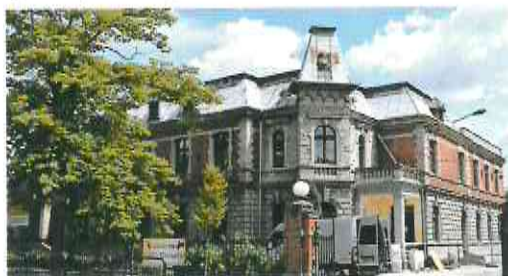
Fotografia nr 1 – budynek przy ul. 23 Stycznia 13, w którym mieści się Szkoła Muzyczna I st. im. Fryderyka Chopina

Przed rozpoczęciem robót budowlanych, Gmina uzyskała decyzję Kujawsko – Pomorskiego Wojewódzkiego Konserwatora Zabytków, zezwalającą na przeprowadzenie robót budowlanych przy zabytku wpisanym do rejestru zabytków.