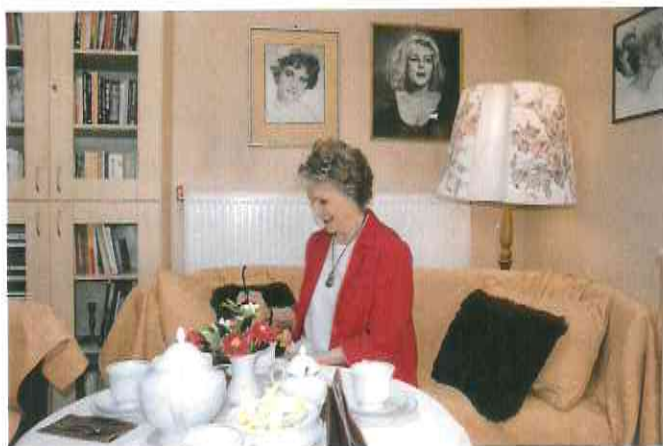
Fotografia nr 8. – Uroczyste otwarcie saloniku p. Ireny Santor

W Bibliotece Publicznej w maju 2018 r. uroczystie otworzyli salonik Ireny Santor, w którym wyeksponowane zostały pamiątki zbierane przez wybitną piosenkarkę - Honorowego Obywatela Solca Kujawskiego. Kameralny salonik wraz z eksponatami z życia piosenkarki, stanowi element promujący miasto oraz dodatkową atrakcję dla przybyłych turystów oraz mieszkańców.