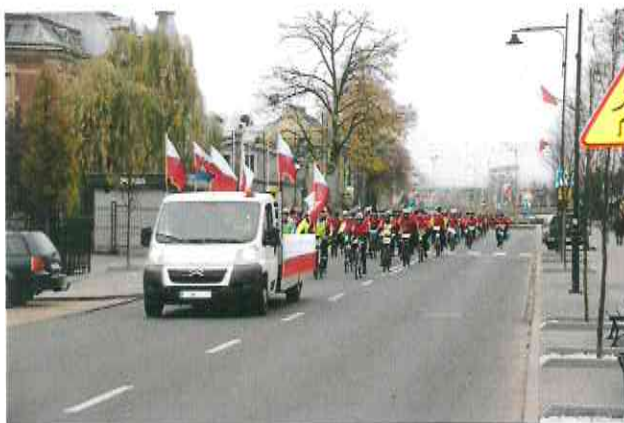
Fotografia nr 11 – uczestnicy Rajdu Rowerowa Brzoza (11.11.2019 r.)

W grudniu 2019 r. w świetlicy wiejskiej, przeprowadzone zostały warsztaty rękodzielnicze skierowane do rolników oraz członkiń Kół Gospodyń Wiejskich z terenu gminy, podczas których uczestniczki poznały obyczaje i tradycje bożonarodzeniowe, ponadto w ramach zajęć wykonały kompozycje i stroiki świąteczne. W sołectwie Chrośna z inicjatywy Rady Sołeckiej oraz Koła Gospodyń Wiejskich, dzieci z terenu wsi wykonały rysunki, które zostały umieszczone na kartkach świątecznych promujących niekwestionowaną „stolicę Puszczy Bydgoskiej”. Kultuwanie tradycji oraz przekazywanie obyczajów i obrzędów ludowych charakterystycznych dla regionu Kujaw to główne cele działalności Kół Gospodyń Wiejskich z terenu sołectw oraz Zespołu „Solecczanie” działającego przy świetlicy „Jagódka”.