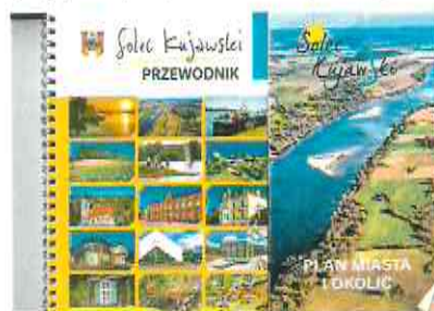
Fotografia nr 5. – Przewodnik po Solcu Kujawskim,

W 2018 r., na zlecenie Urzędu Miasta i Gminy w Solcu Kujawskim, za pośrednictwem Wydawnictwa Pejzaż, wydano przewodnik po Solcu Kujawskim wraz z planem miasta i okolic. W przewodniku zawarte zostały podstawowe informacje z zakresu zrealizowanych oraz rozpoczętych inwestycji, turystyki, kultury i sportu na terenie miasta oraz całej gminy.