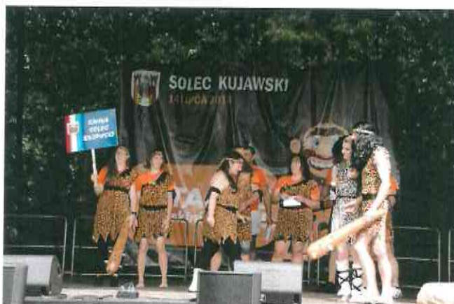
Fotografia nr 9. – Turniej Gmin Powiatu Bydgoskiego – Sołtysiada

przewodniego turnieju. Zwieńczeniem turnieju były koncerty disco polo, które gwarantowały dobrą zabawę do późnych godzin wieczornych.