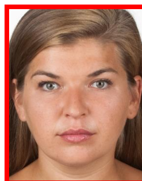
zbyt duża twarz