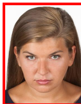
tzw. ptasia perspektywa