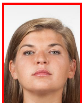
tzw. żabia perspektywa