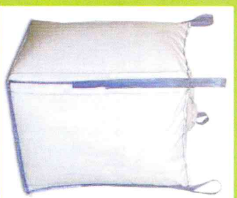
WOREK BIG-BAG 1 m 3