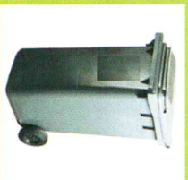
POJEMNIK 240 LITRÓW