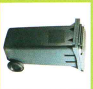
POJEMNIK 120 LITRÓW