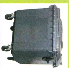
POJEMNIK 1100 LITRÓW