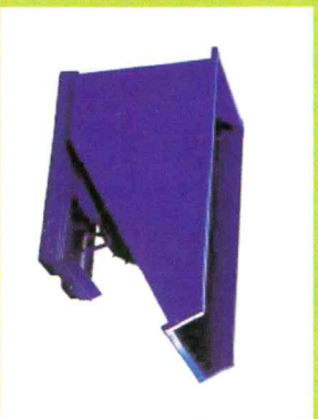
KONTENER 1,5 m 3