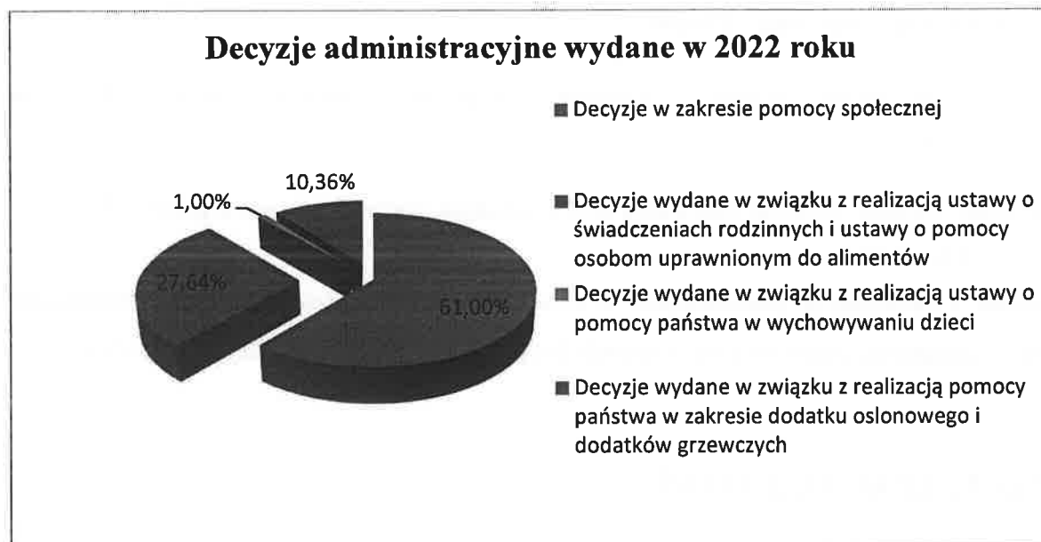
Wykres 1. Procentowe przedstawienie liczby wydanych decyzji w 2022 r.

W 2022 roku zdecydowana większość wydanych decyzji administracyjnych związana była z realizacją ustawy o pomocy społecznej, jako głównych zadań realizowanych przez Ośrodek. Najmniejszy procent stanowiły decyzje dotyczące pomocy państwa w wychowywaniu dzieci („Program 500+”). Wynika to ze zmiany w ustawie z 2019 roku, konsekwencją której było wprowadzenie zasady dotyczącej załatwiania spraw poprzez wydanie informacji o przyznaniu świadczenia 500+, a nie decyzji, które dotyczyły jedynie odmowy przyznania świadczenia lub wydania decyzji o nienależnym pobieraniu świadczeń. Ponadto, od stycznia do maja 2022 roku, Ośrodek zajmował się głównie realizacją przyznanych świadczeń, gdyż przyjmowanie nowych wniosków o przyznanie praw do otrzymywania świadczeń 500+ przejął Zakład Ubezpieczeń Społecznych.