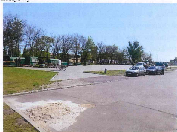
Miejsce pod planowany Park&ride