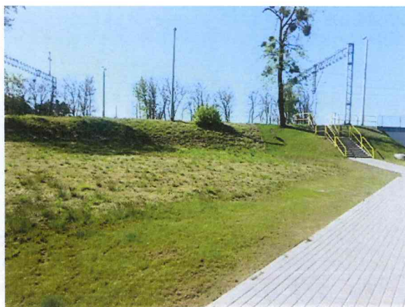
Miejsce pod Punkt Obsługi Podróżnych oraz Bike&ride

Dokumentacja w powyższym zakresie stanowi załącznik nr 3 do akt kontroli.