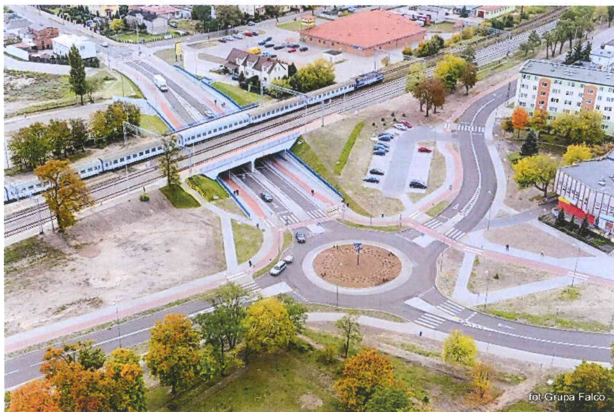
Zdjęcie przekazane przez Beneficjenta obrazujące zrealizowane zadanie I.

W dniu 07.05.2015 r. ZK przeprowadził oględziny miejsca realizacji Projektu podczas których sporządzono dokumentację fotograficzną.