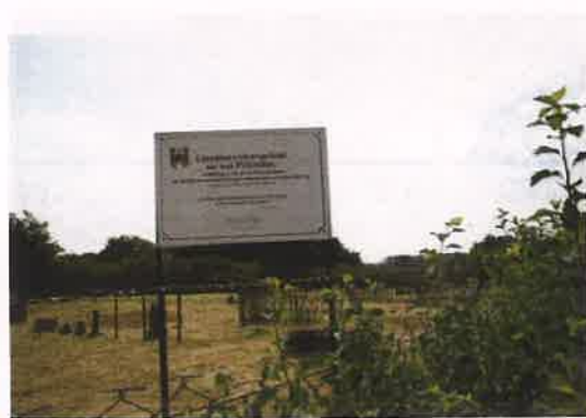
Fotografia nr 24 Tablica pamiątkowa na cmentarzu w Przyłubiu

Kontynuacją podjętych działań mających na celu ocalenie grobów o znacznej wartości artystycznej oraz wartości historycznej było utworzenie listy wraz z dokumentacją fotograficzną grobów znajdujących się na cmentarzu wpisanym do wojewódzkiej ewidencji zabytków przy ul. Ks. P. Skargi. W ramach podjętych działań pomiędzy gminą, a organizacjami pozarządowymi oraz instytucjami i stowarzyszeniami zawarte zostały umowy patronackie, na podstawie których opieką zostały objęte mogiły i pomniki upamiętniające dawnych