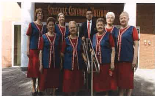
Fotografia nr 25 Zespół Inwencja w strojach folklorystycznych

3 lipca 2021 r. w ramach kolejnej edycji rajdu rowerowego Odjazdowy Bibliotekarz, bibliotekarze wraz czytelnikami oraz miłośnikami rowerów