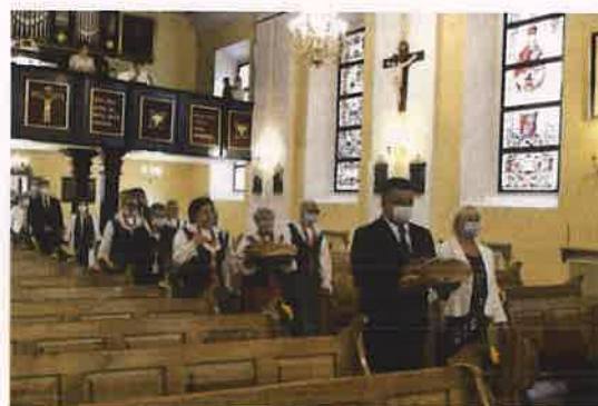
Fotografia nr 16 Dożynki Gminne 2020 r.

5 września 2020 r. w kościele pw. św. Stanisława Biskupa i Męczennika odprawiona została uroczysta msza święta z udziałem delegacji sołectw oraz osiedli. Przed kościołem odprawiony został obrzęd dożynkowy, w trakcie którego rozdane zostały poświęcone wcześniej chlebki dożynkowe. Do kościoła wniesione zostały kosze oraz wieniec dożynkowy wykonany przez sołectwo Przyłubie. Przeprowadzony w minimalistycznej formie obrzęd ludowy pozwolił na kontynuację przyjętej na terenie gminy tradycji będącej formą podziękowania za zebrane zbiory i plony.