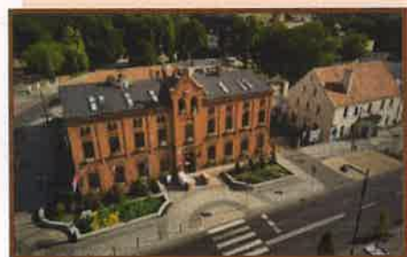
Fotografia nr 1 Urząd Miejski w Solcu Kujawskim

Gminny Program Opieki nad Zabytkami ma charakter dokumentu uzupełniającego w stosunku do aktów planowania obejmujących działania na terenie całego kraju, jak i dokumentów planowania o zasięgu lokalnym.