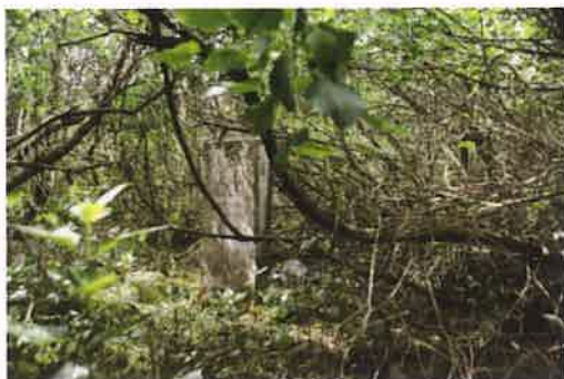
Fotografia nr 12 Stela z cmentarza w Wypaleniskach

W 2021 r. przeniesiono dwie stele z piaskowca odnalezione podczas przeprowadzonych prac porządkowych na terenie cmentarza ewangelickiego we wsi Chrośna. Powyższe działanie uzyskało również pozytywną opinię konserwatora zabytków.