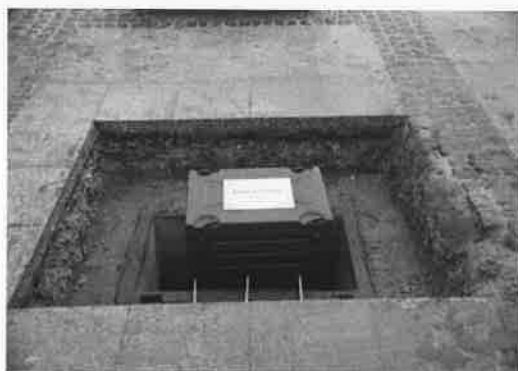
Fotografia nr 10,11 Kapsuła czasu

Na obszarze zdegradowanym, wyznaczonym uchwałą Nr XVII/158/16 Rady Miejskiej z dnia 17 czerwca 2016 r. w 2021 r. rozpoczęto prace związane z zagospodarowaniem reprezentacyjnej części miasta - Placu Jana Pawła II. W listopadzie 2021 r. pod płytą rynku umieszczono kapsułę czasu, w której umieszczono między innymi rocznik „Soleckich Wiadomości z Ratusza” oraz Księgę Pamiątkową z wpisami mieszkańców miasta.