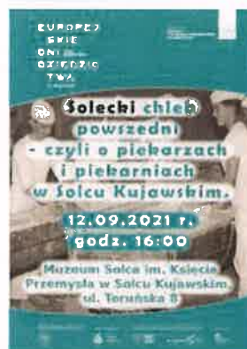
Fotografia nr 29

We wrześniu na ręce Burmistrza Solca Kujawskiego przekazany został okolicznościowy medal przyznany dla gminy z okazji zakończenia obchodów 100 – lecia powrotu Kujaw i Pomorza do Polski. Medal przyznany został za zasługi dla idei upamiętnienia jubileuszu , a także za zaangażowanie w organizację obchodów instytucji, organizacji, oraz szkół.