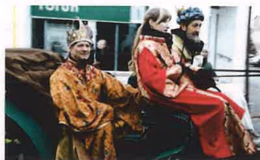
Fotografia nr 13 Orszak Trzech Króli

Z początkiem 2020 r. na terenie gminy rozpoczęły się uroczyste obchody 100-lecia powrotu Solca do Polski. 16 stycznia 2020 r. w Muzeum Solca im. Księcia Przemysła nastąpiło otwarcie