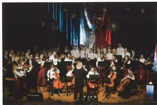
Fotografia nr 14 Koncert Szkoły Muzycznej 17 stycznia 2020 r.

18 stycznia 2020 r. w ramach jubileuszu odbył się rajd pieszy „Świadkowie historii” zorganizowany przez Klub Turystów Piesznych „Horyzont” oraz Muzeum Solca im. Księcia Przemysła w Solcu Kujawskim. Na mecie rajdu zakończonego w budynku Muzeum Solca uczestnicy mogli obejrzyć nową wystawę czasową pt. „Pozdrowienia z Solca.... Solec Kujawski na starych pocztówkach”. Na zakończenie dnia przed Soleckim