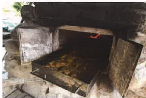
Fotografia nr 22 Warsztaty z pieczenia chleba

W ramach konkursu na wykonanie zadania publicznego w zakresie kultury, sztuki, ochrony dóbr kultury i dziedzictwa narodowego w 2020 r. dofinansowana została działalność Ochotniczej Straży Pożarnej w Solcu Kujawskim, na zadanie związane z upowszechnianiem tradycji ochotniczych straży pożarnych, poprzez działalność Orkiestry Dętej. Dofinansowaniem zostały objęte działania w okresie od 20.01. - 31.12.2020 r.