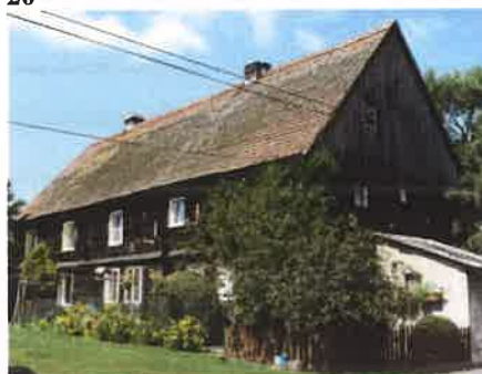
Fotografia nr 8 Dawny spichlerz „Czarna Warszawa- Otorowo 20

W ostatnim miesiącu objętym sprawozdaniem Gmina Solec Kujawski podpisała z Urzędem Marszałkowskim umowę o przyznaniu pomocy na realizację projektu pn. „Przebudowa świetlicy we wsi Przyłubie w Gminie Solec Kujawski oraz adaptacja pomieszczeń w Bibliotece Publicznej i Muzeum Solca”.