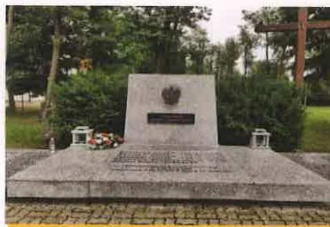
Fotografia nr 7 Mogiła Zbiorowa Pomordowanych w 1939 r.

Na mogile zamontowano także tablicę z napisem „OFIAROM TERRORU OKUPANTA NIEMIECKIEGO 1939” w miejsce poprzedniej tablicy o treści: „OFIAROM TERRORU HITLEROWSKIEGO 1939” oraz nowy granitowy lampion w miejsce poprzedniego. Prace zrealizowała firma PWPUH GRANIT Adam Grabowski za kwotę 24 477,00 zł.