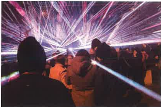
Fotografia nr 15 Pokaz iluminacji – Wiwat Solec Kujawski

19 stycznia 2020 r. po uroczystej mszy świętej odprawionej w intencji Ojczyzny, licznie zebrane delegacje złożyły wiązanki kwiatów na Mogile Zbiorowej Powstańców Wielkopolskich.