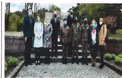
Fotografia nr 18

Liczne działania edukacyjne związane z szeroko rozumianym dziedzictwem kulturowym podejmowane były przez Związek Harcerstwa Polskiego Hufiec Solec Kujawski. Wśród nich można wymienić: