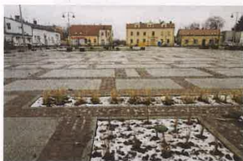
Fotografia nr 5,6 Plac Jana Pawła II

W ramach zawartej umowy na prace rewitalizacyjne przeznaczono ok. 3,9 mln zł. Wartość zadania ogółem to 6.095.483,33 zł, w tym dofinansowanie z Funduszu Rozwoju Regionalnego wyniosło 2.619.035,01 zł, a dofinansowanie z budżetu państwa 504.949,09 zł. Projekt zakończono dnia 31.12.2021r.