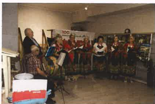
Fotografia nr 21 100 rocznica powrotu Solca do Polski

Każdego roku członkinie Kół Gospodyń Wiejskich uczestniczą w warsztatach szkoleniowych, podczas których doskonalą swoje umiejętności oraz poszerzają wiedzę w różnorodnej tematyce. Głównym celem szkolenia jest podtrzymanie tradycji ludowych związanych z dziedzictwem kulturowym wsi oraz regionu, a także możliwość przekazania zdobytej wiedzy przez uczestniczki szkoleń młodemu pokoleniu. Tematem szkolenia przeprowadzonego jesienią 2020 r. było kształtowanie krajobrazu celem polepszenia estetyki