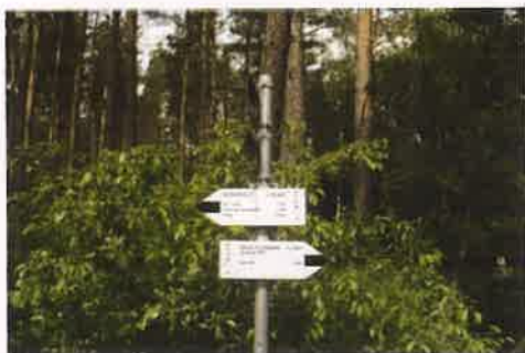
Fotografia nr 23 Szlaki turystyczne na terenie gminy Solec Kujawski

W kolejnym roku kalendarzowym ukazał się podwójny numer soleckiego rocznika wydawanego przez Muzeum Solca im. Księcia Przemysła. W roczniku zawarte zostały informacje dotyczące historii miasta jak również materiały archiwalne z okresu II wojny światowej oraz wspomnienia osoby bł. Czesława Józwiaka i Jerzego Szatkowskiego, a także solecczan, którzy odeszli w latach 2019 i 2020.