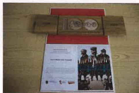
Fotografia nr 30 Medal okolicznościowy

Sprawozdanie z realizacji Gminnego Programu Opieki nad Zabytkami dla Miasta i Gminy Solec Kujawski w latach 2020-2021