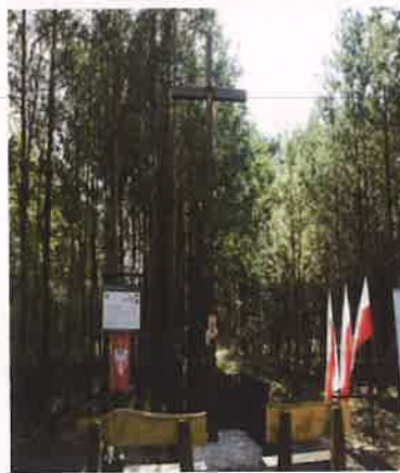
Fotografia nr 9 Krzyż Powstańców Wielkopolskich

6 listopada 2020 r. na podstawie decyzji Wojewódzkiego Inspektora Nadzoru Budowlanego a także opinii Instytutu Pamięci Narodowej zdemontowana została płyta pamiątkowa, na której umieszczona była treść napisu budząca od samego początku kontrowersje wśród mieszkańców. Po przeprowadzonej analizie historycznej, między innymi z braku informacji o zamordowanych w tym miejscu mieszkańców podjęta została decyzja o demontażu płyty. Tablica pamiątkowa została umieszczona w Muzeum Solca im. Księcia Przemysła