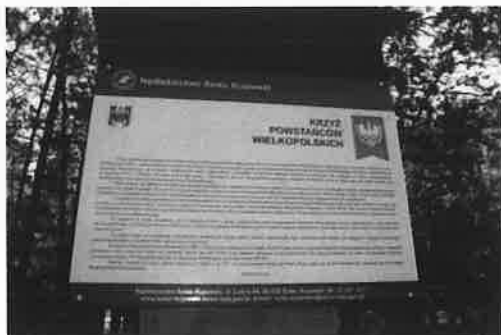
Fotografia nr 17 Tablica- Krzyż Powstańców Wielkopolskich

20 września 2020 r. w ramach cyklicznego wydarzenia jakim są Europejskie Dni Dziedzictwa, Muzeum Solca im. Księcia Przemysła zaprosiło mieszkańców oraz turystów na spacer z historią, którego tematem przewodnim były „Ulice Solca i ich metamorfoza”. W trakcie spotkania uczestnicy mieli możliwość poznać dawne nazwy ulic naszego miasta oraz liczne ciekawostki